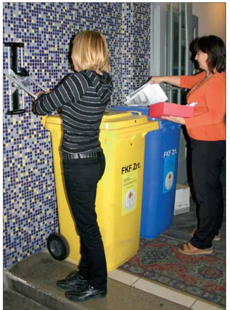
Az FKF Zrt. házáknak két hulladékgyűjtő edényt helyeztek ki a lépcsőházakba; a kék színű a papír, a sárga a műanyagok gyűjtésére szolgál