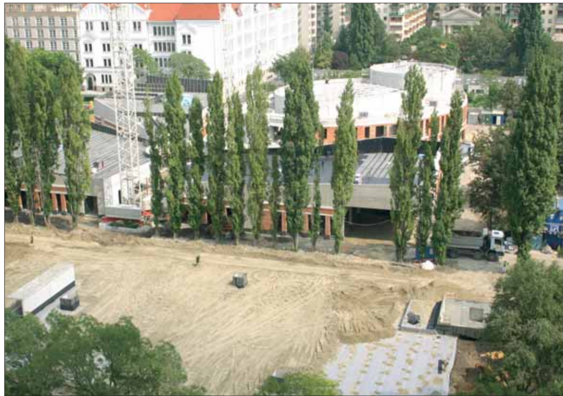
A Kárpát utcai oldalon 100 gépkocsi befogadására alkalmas terepszint alatti garázt is kialakítanak, a tervezéskor külön szempont volt a meglévő faállomány védelme