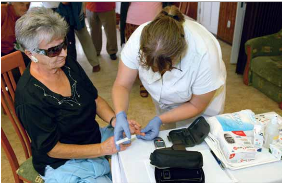
A távellenőrzési (Medistance) rendszer október 4-én indult

A vizsgálatokhoz szükséges szakembergárdát, valamint a berendezéseket az egészségügyi szolgálat biztosította. A meghatározott nemű, illetve korcsoportú kerületi lakók előzetes, személyes bejelentkezés alapján, házi-