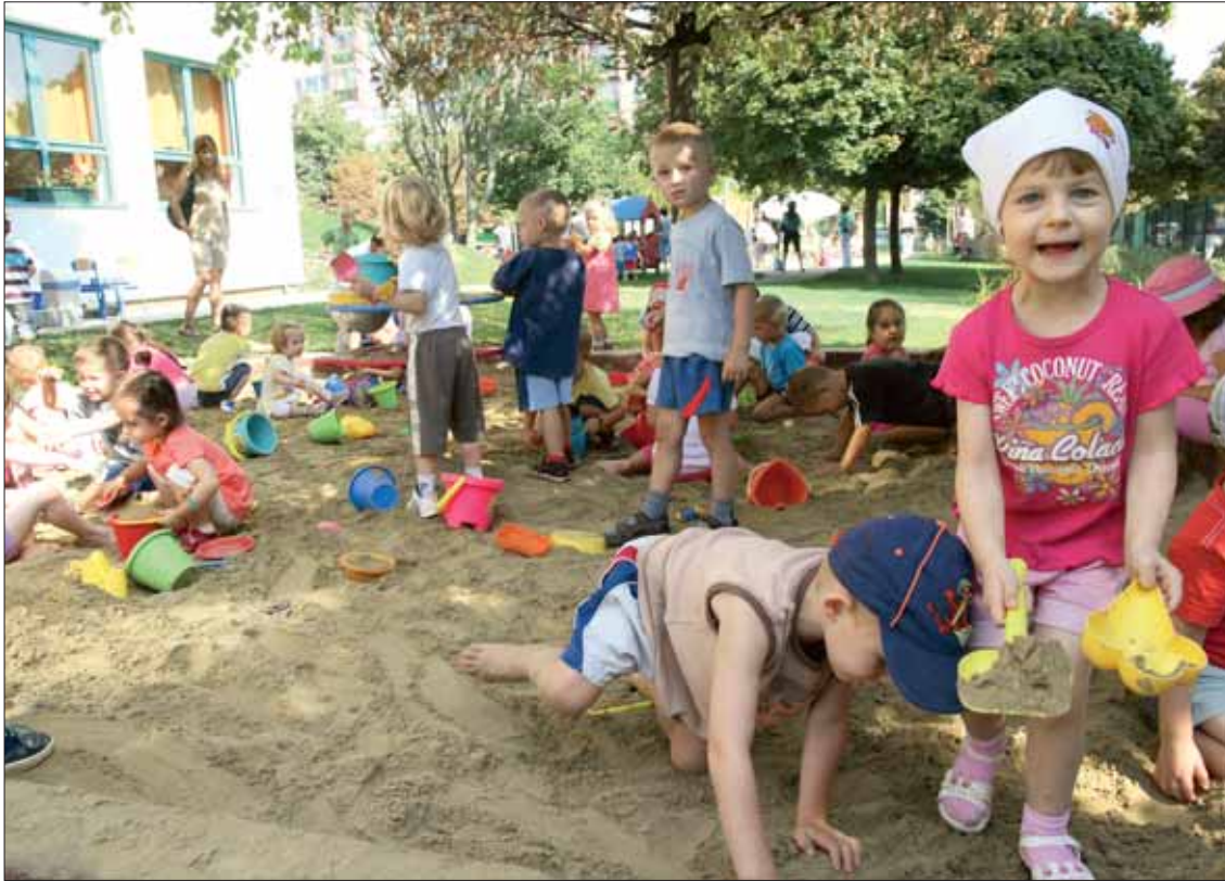
A Pitypang tagóvoda a teljes átalakítás után XXI. századi körülményeket biztosít gyermekeinknek

– Az oktatási intézmények felújítására valóban rövid idő, 2-2,5 hónap áll rendelkezésre. Ezt, a munkavégzés szempontjából megfelelő időt kell minél hatékonyabban kihasználni. Csak jól szervezett, pörgős munkával tudjuk a szükséges feladatokat elvégezni, ezáltal az intézményeket időben átadni.