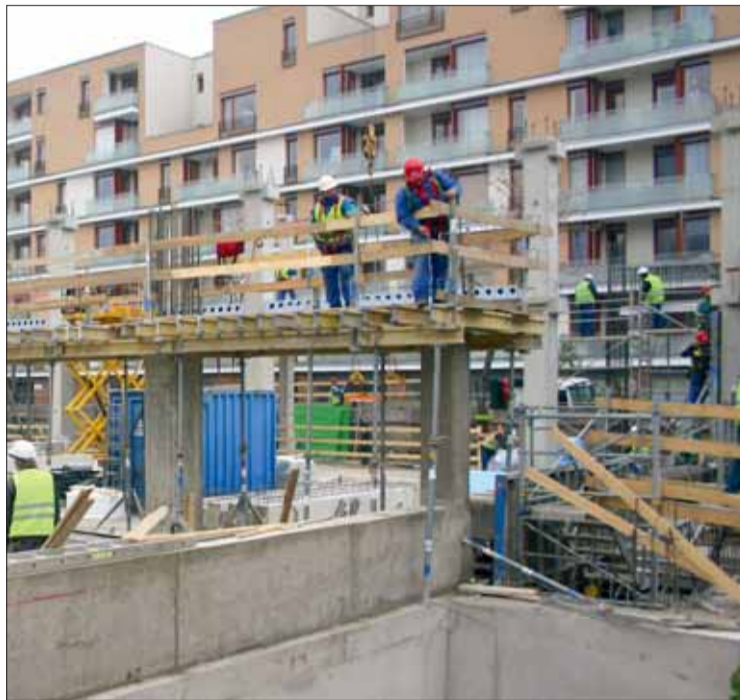
Zajjal járó építési tevékenységet csak meghatározott napokban lehet végezni

– A szabályozás új eleme, hogy a zajvédelmi hatóság engedélyében a rendezvény ideje alatti zajmérést is előírhat, ami lehetővé