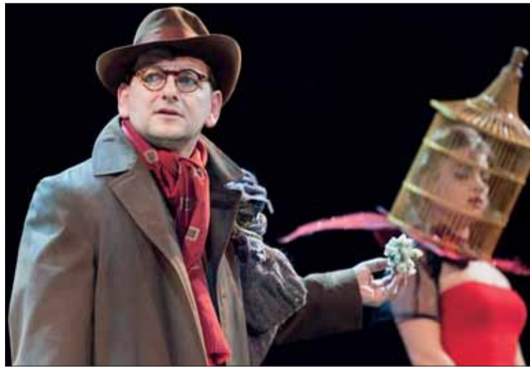
A makrancos Kata.