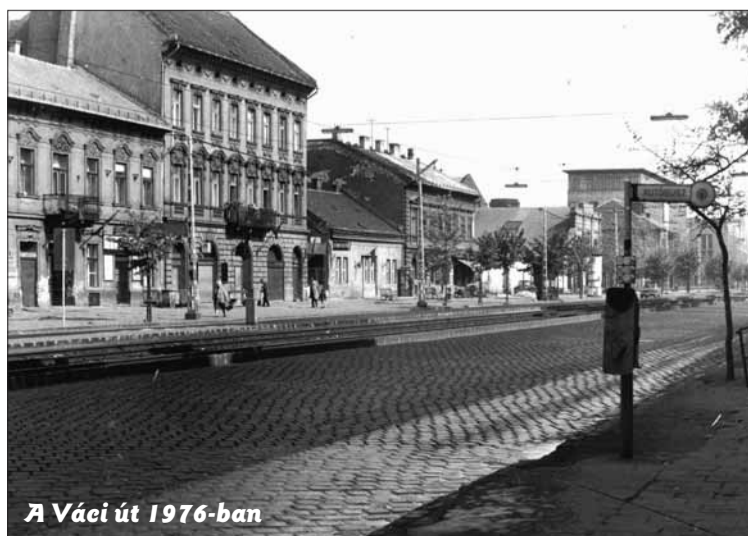
A Váci út 1976-ban

Jelentkezni március 14-ig lehet telefonon (320-3842), SMS-ben (06-30-453-3693) vagy e-mailben (helytorteneti@kult13.hu), továbbá személyesen az Angyalföldi József Attila Művelődési Központ (József Attila tér 4.) információs pultjánál. A jelentkezéskor meg kell adni a versenyző nevét, címét, telefonszámát, e-mail címét és életkorát. További információ: www.kult13.hu .