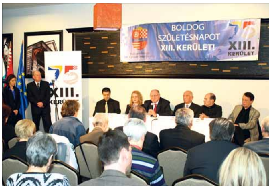
Az évforduló erősíti a kerülethez tartozás érzését, egész évben számos program várja a lakosságot

kalommal megrendezendő Angyalföldi Utcazenei Fesztivál, a Ruttkai Éva-szobor avatása és a július 1-jei Béke téri ünnepi koncert a Republickal. Emellett számos kiállítás, filmvetítés és egyéb közösségi program várja az itt élőket és az idelátogatókat egyaránt.