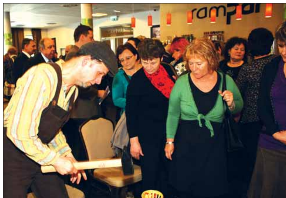
A jeles rendezvénysorozaton lehetőség lesz kerületi pénzérme készítésére, az első példányokra sok jelentkező volt

Születésnap fotópályázat Ismert házak ismeretlen képeken