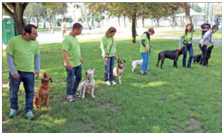
Az ebek tanításával és a gazdik odafigyelésével sok (kutya és kerékpáros) összeférhetlenség is megszüntethető