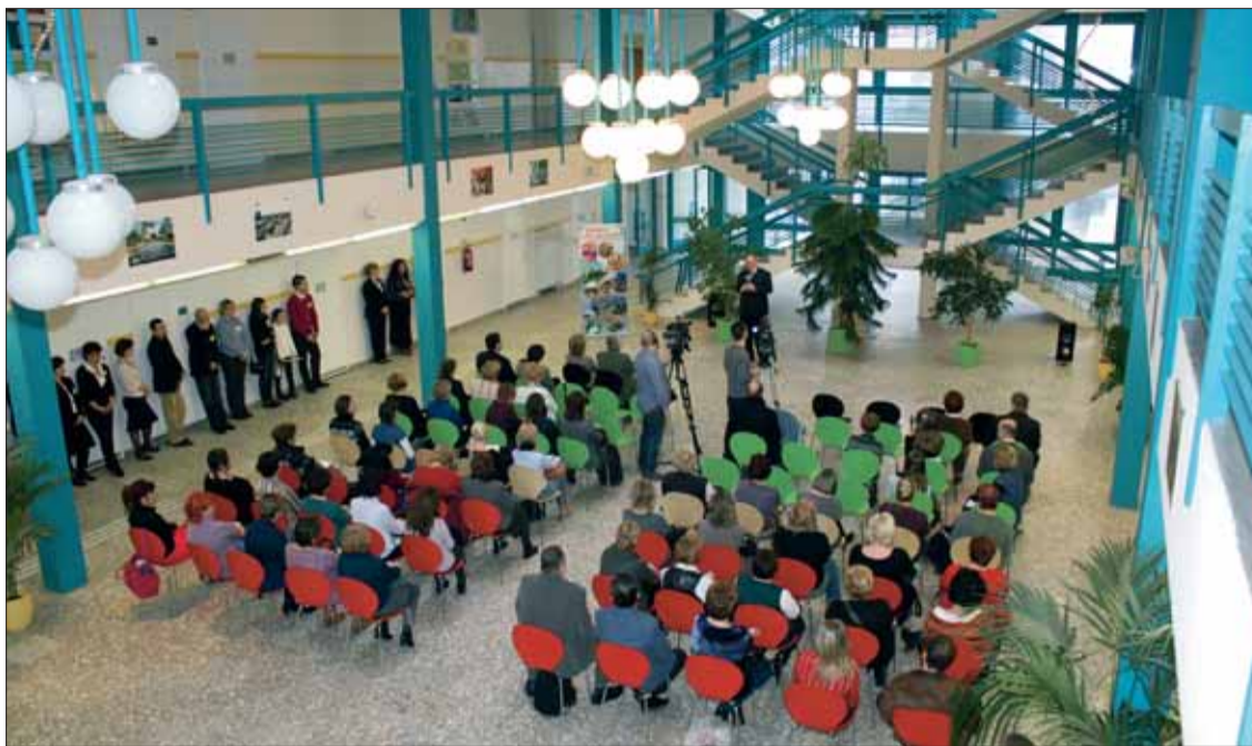
Megnyílt az Új Prevenció Központ a Tüzér utcában, egy helyen kaptak otthont olyan szociális intézmények, mint a Híd Családsegítő vagy a Gyermekejélési Központ

Az Alkotmánybíróság egyévi halogatás után, de különös