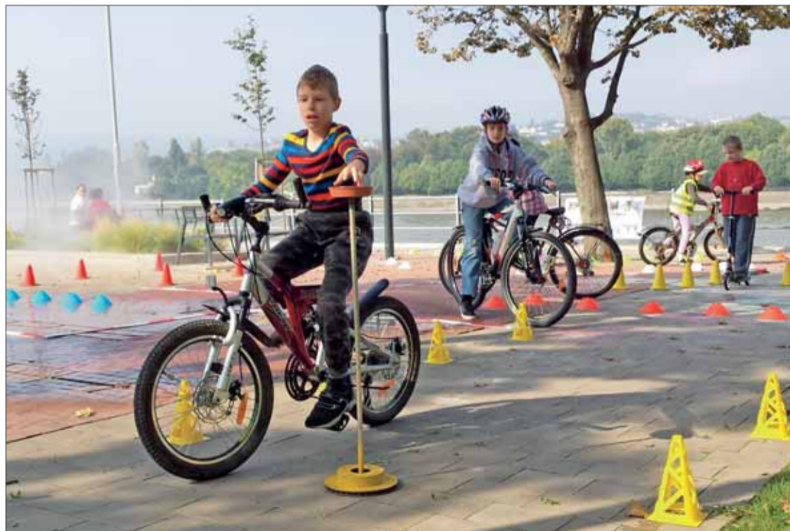
A szabadidőterén bringás ügyességi versenyeken a kerékpáros KRESZ-előírással kapcsolatos helyes válaszokért értékes közlekedésbiztonsági felszereléseket lehetett nyerni