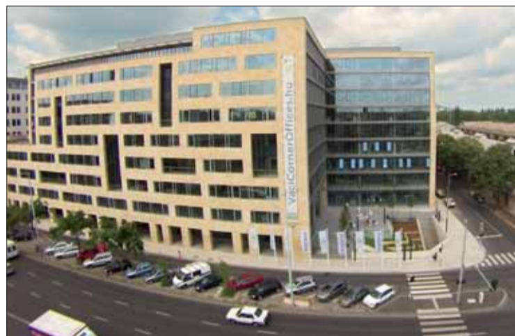
A kerületben folytatódtak a nagycéges, kizárólag „zöldtechnológiás” fejlesztések, átadták a Váci Corner Office-t

Az önkormányzat minden esztendőben stabil költségvetéssel, hitelfelvétel nélkül működött, fejlesztésre évente a költségvetés egyötödét költötte. A kerület vagyona folyamatosan növekedett, jelenleg 93,5 milliárd forint. Míg Budapesten másutt drasztikusan lecsökkent a beruházások száma, itt a kerületben – ha nem is a 2008 októbere előtti időszakhoz hasonló mértékben –, de folytatódtak a nagycéges, kizárólag „zöldtechnológiás” fejlesztések.