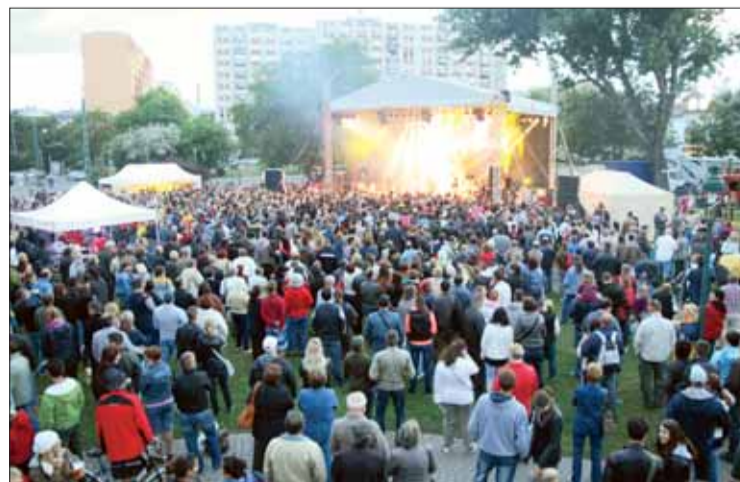
Látványos és népszerű kulturális és sportprogramokkal ünnepeltük 2013-ban a 75 éves kerületet