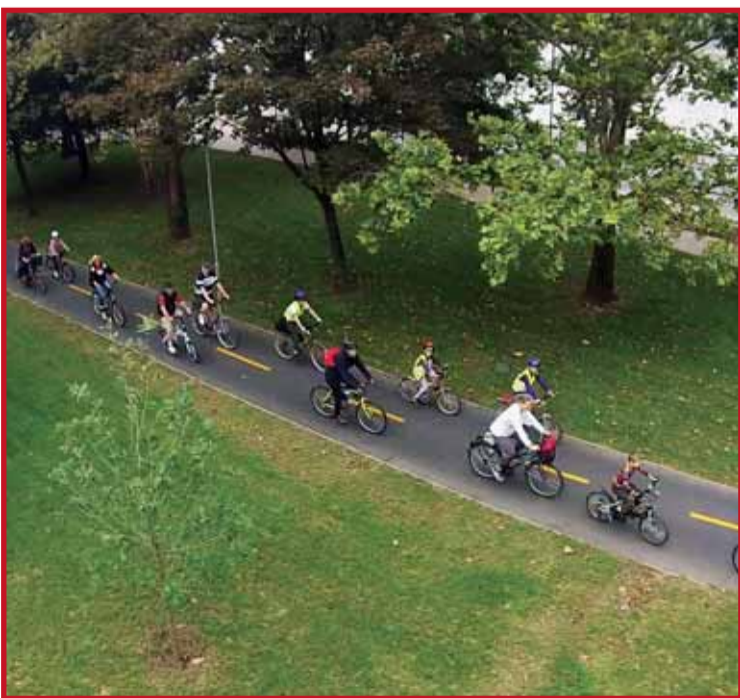
Budapesten az elmúlt években robbanásszerűen nőtt a biciklit, mint közlekedési eszközt rendszeresen használók száma