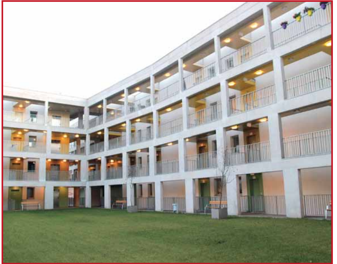
A FIABCI Magyar Tagozata és a Magyar Ingtatlanszövetség I. díját, valamint a környezettudatos építés kategóriában ugyancsak első díjat kapott a 100 lakásos passzívház

Az intézményfelújítási programok majdnem mindegyikében szerepelnek az energiatakarékos-sággal kapcsolatos elemek. Számuk az elmúlt nyolc évben 106 volt, több mint 12 milliárd forintért. Kiemelkedő jelentőségű az önkormányzat saját finanszírozásában megépült 100 lakásos passzívház, amely a megvalósított olcsóbb fenntarthatóság és klímavédelmen túl a szélesebb közvélemény szemléletformálásban is kiemelkedő szerepet kap. Felújítások esetében a szakemberek megvizsgálják a megújuló energiaforrások használatának lehetőségét, így például a Madarász és a Napraforgó Tagóvo-