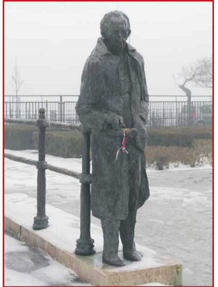
Lukács György születésének 100. évfordulóján avatták fel szobrát — Varga Imre alkotását — a Szent István parkban 1985-ben. A Magyar Tudományos Akadémia és a Fővárosi Tanács közösen emelte a szobrot. Az avatónépszerűen Szentágotthai János, az MTA akkori elnöke méltatta a filozófust