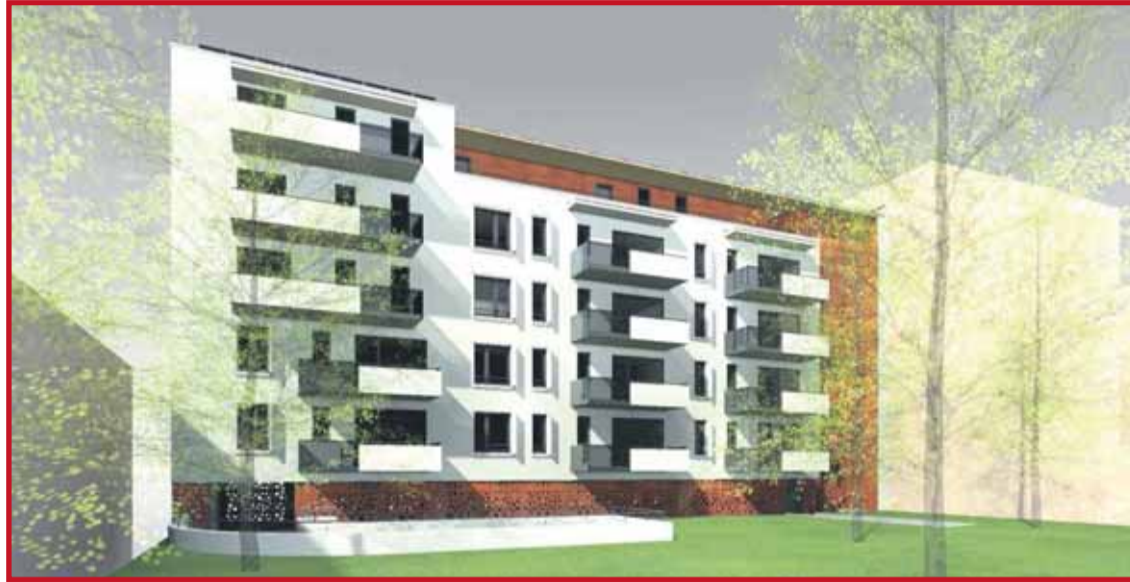
A Kartács utca 14. szám alatti 23 lakásos, csaknem egymilliárdból épülő önkormányzati bérház megfelel a passzívház kritériumainak, átadása jövő év elejére várható

A 2015-ös program felülvizsgálata az időarányos teljesítések alapján még idén februárban megtörtént. A ciklusterv ütemezése az épületek állapotának felmérésén alapul. Az önkormányzat minden évben az eredetileg tervezett sorrendiség felülvizsgálatával készíti el az éves rekonstrukciós terveket, figyelembe véve az intézményvezetők véleményét. A beruházásokkal a kerület teljesíti a klímastratégiaájában vállalt célkitűzéseit, ehhez megfelelő energetikai jellemzőkkel rendelkező épületeket valósít meg 2020-ig. Különösen ide so-