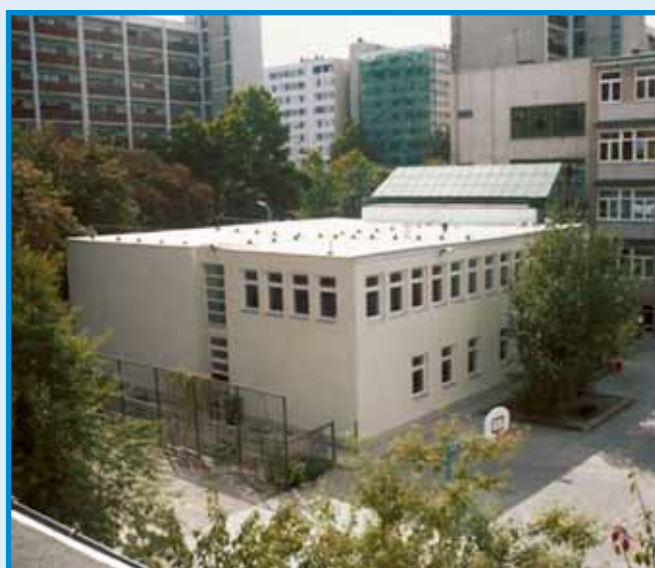
Kívül-belül megújult a tornacsarnok a Hunyadi Mátyás iskolában