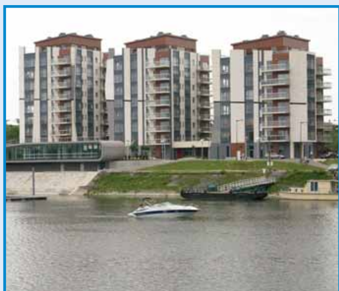
Prestige Towers a Meder utcában