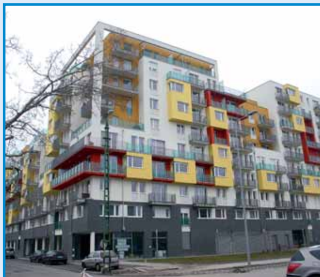
Új lakóépület a Cserhalom utcában