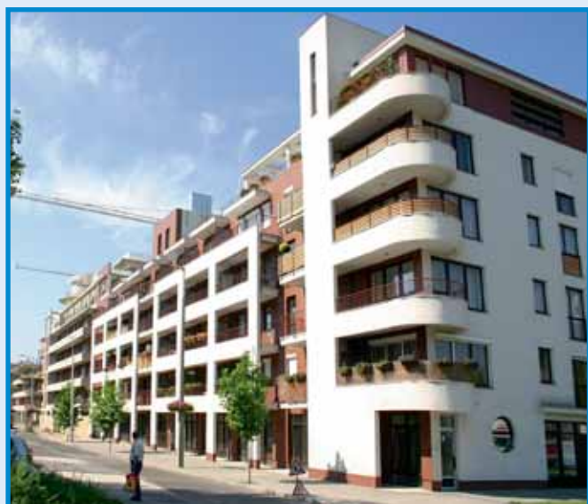
Új társasház a Párkány u. 8.-ban