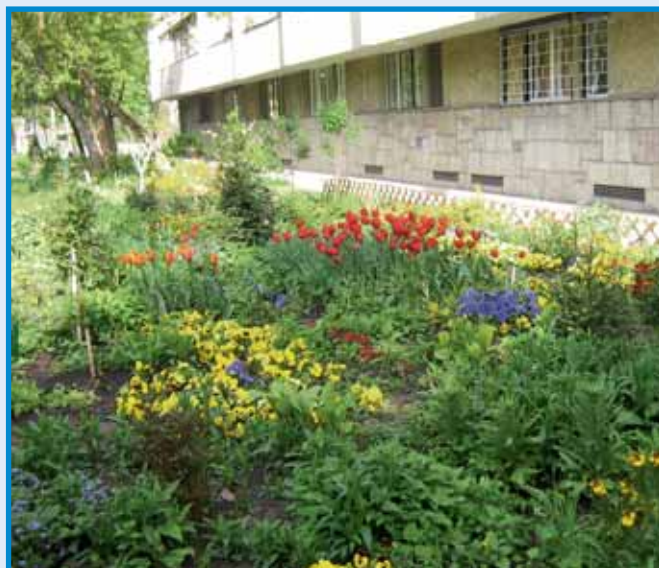
Nyertes előkert a lakossági zöldterület védnökségi pályázaton