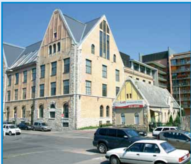
Révész u. 27-31.