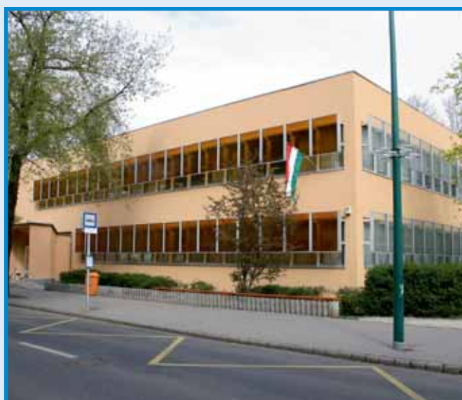
Megújult a Dagály utcai könyvtár