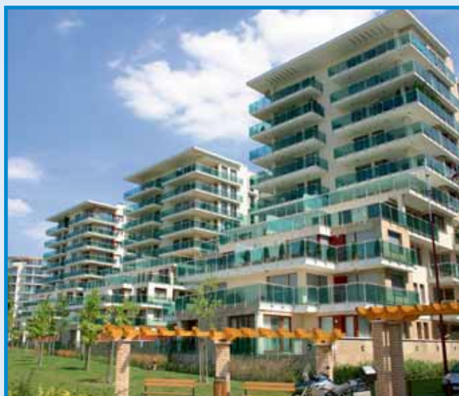
Danubius u. 4–10. a Marina-parton