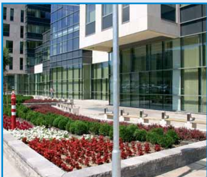
A Népfürdő u. 27.-Dunavirág u. 2-6.-ba költözött a Magyar Posta