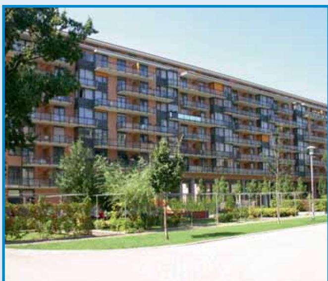
Lakóház a Népfürdő u. 3.-ban