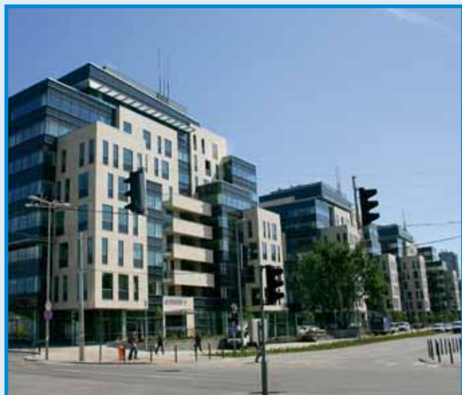
Új utak a Dunavirág és a Népfürdő utcában