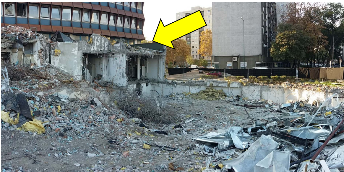
2. fotó: Déli épületszárny nyugati oldali oldalához kapcsolódó lepényépület maradványa; vizuális vizsgálat során azbesztet azonosítani nem sikerült