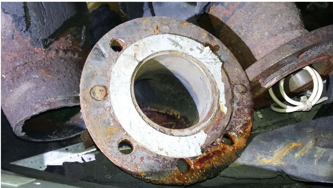
4. fotó: Azbeszttartó Klingerit karima tömítés a déli toronyépület földszinti gépházában