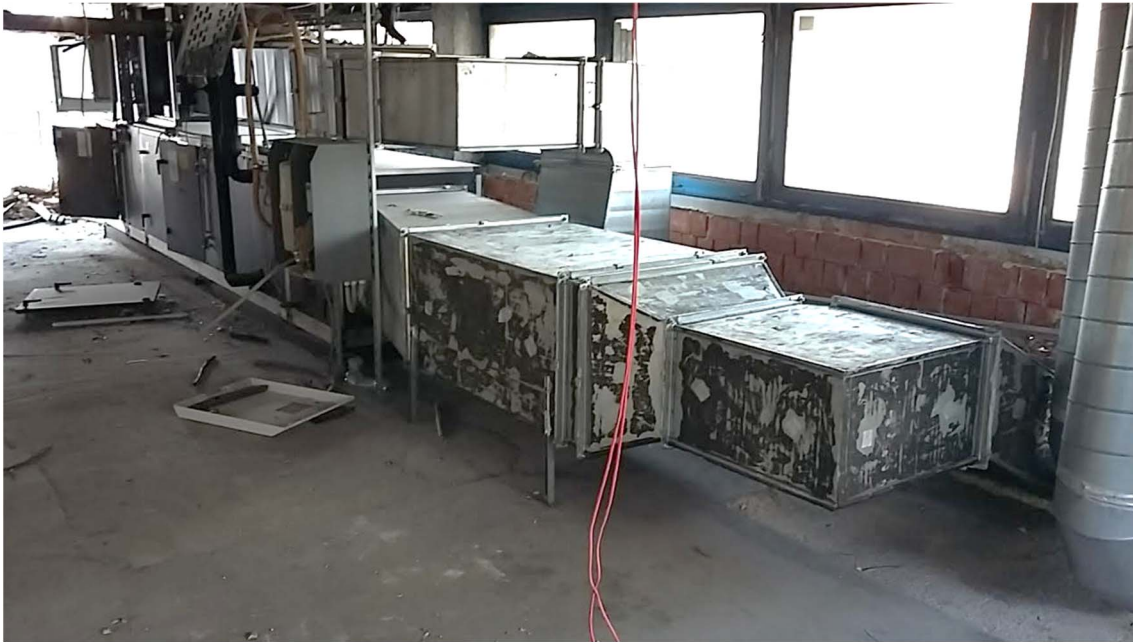
3. fotó: Északi épületszárny I. emeleti szellőzőgépház; vizuális vizsgálat során azbesztet azonosítani nem sikerült