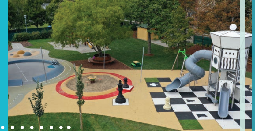
Az Országbíró utcai óvoda megújult udvara