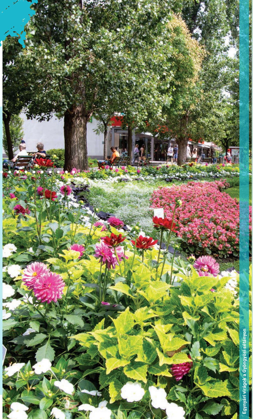
Egyényári virágok a Gyöngyösi sétányon