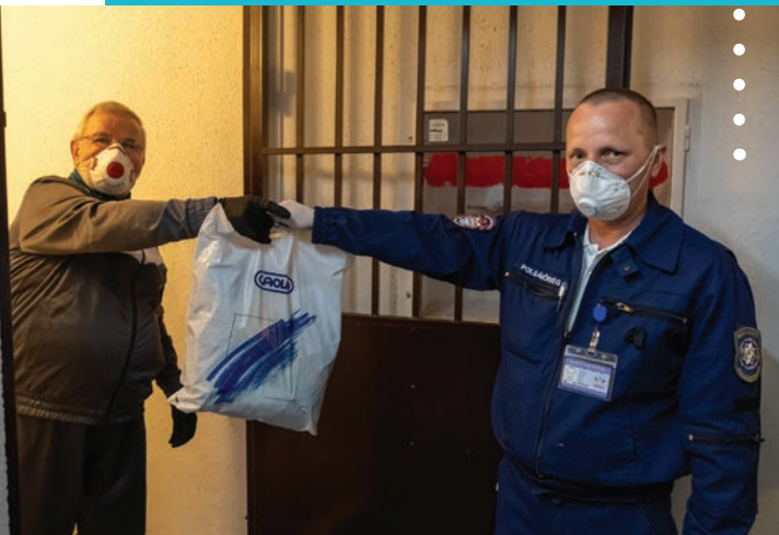
A polgárőrök is segítettek a kerületben élőket