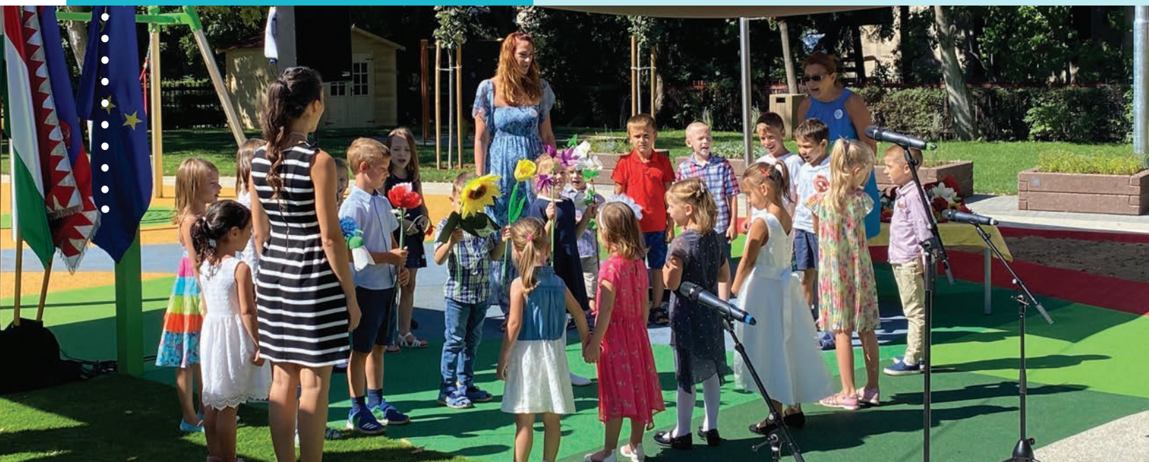
Évnyitó ünnepség a Futár utcai óvodában