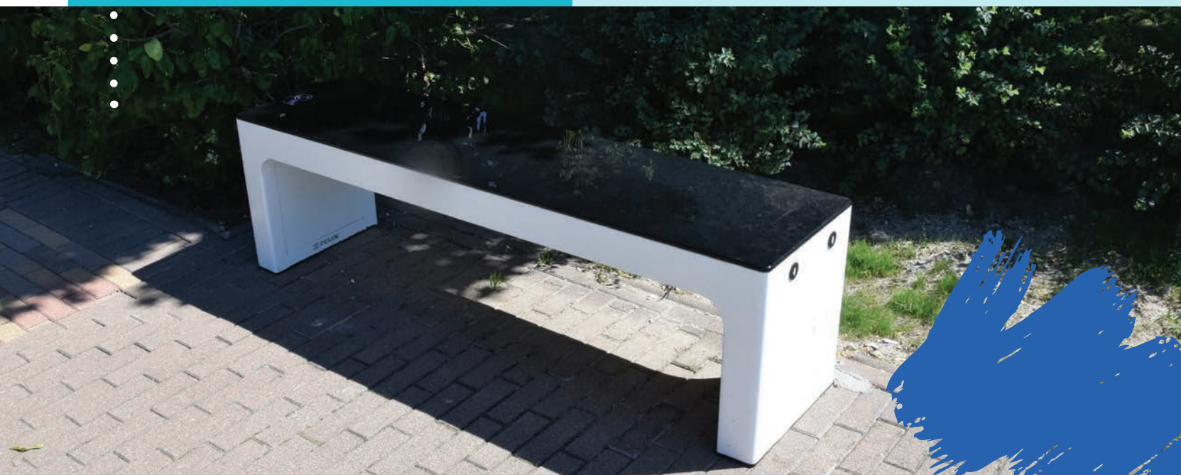
Okospad a Marina parton