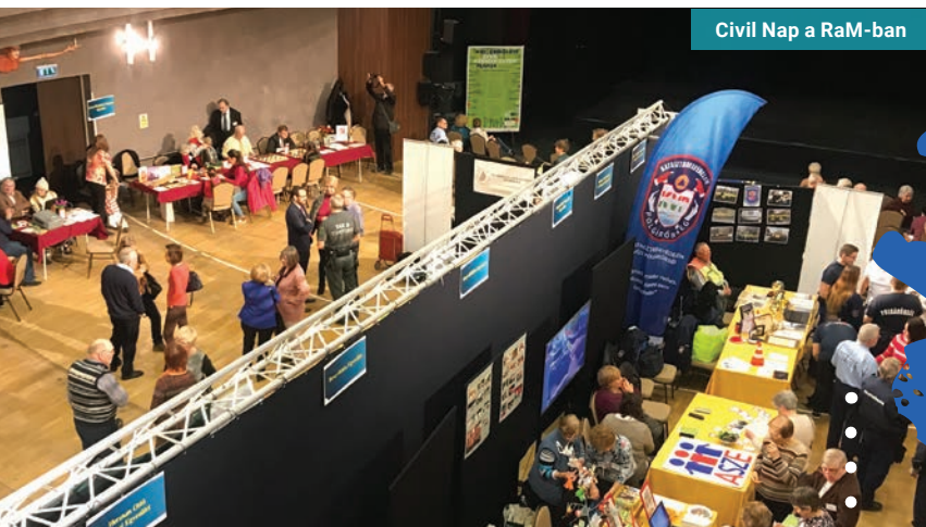
Civil Nap a RaM-ban