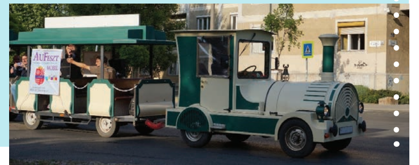
Zenélő kisvonat a Göncöl utcában