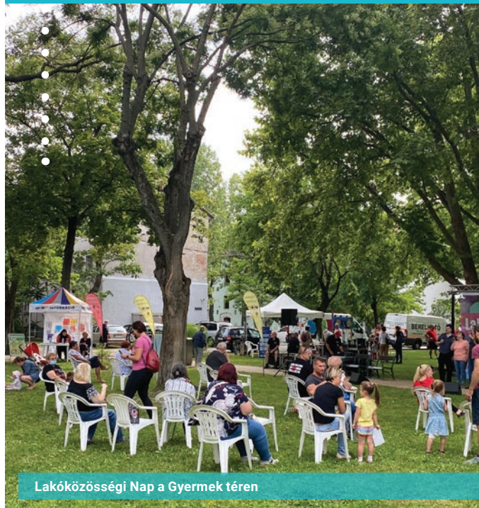
Lakóközösségi Nap a Gyermek téren