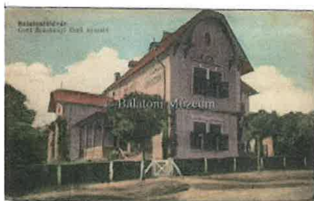
Eliette-villa (Balatonföldvár, 1916)