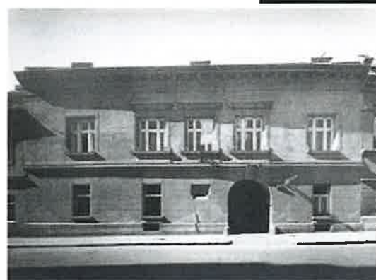
Úri utca 6. (Budai vár, kb. 1941-1942)