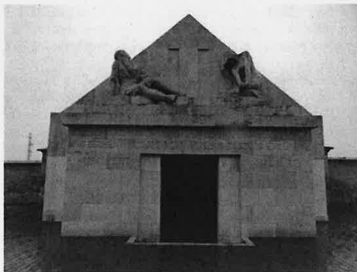
Az I.világháborúban hősi halált halt (1915) gróf Széchényi Alajos nagyecenki, Kisfaludi Strobl Zsigmond szobrokkal díszített, és 2019-ben állami támogatással felújított kriptája. Itt nyugszanak a szülők és a fiútestvérek mellett Pál Imre gróf egyetlen fiának, Elemérnek a hamvai is.