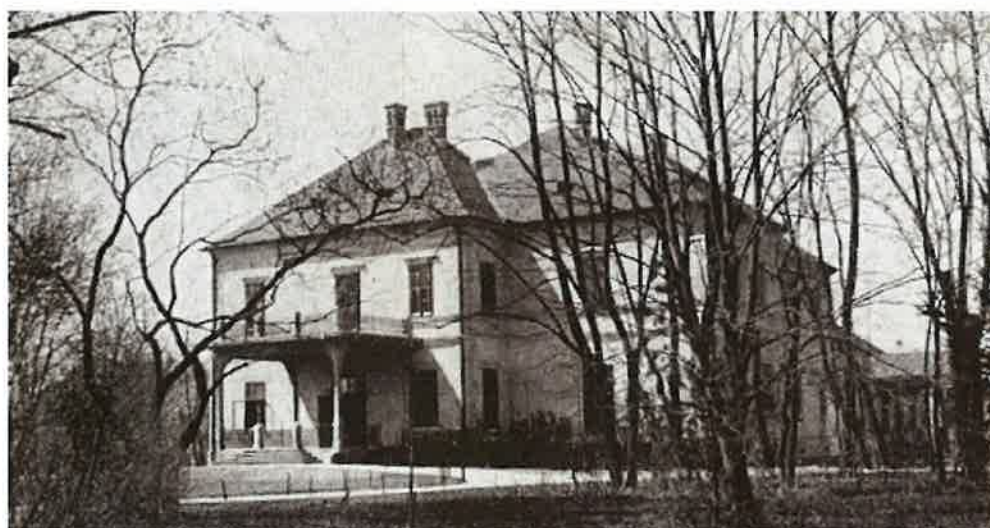
A vajszkai Hunyady-Széchenyi kastély (Bácska)