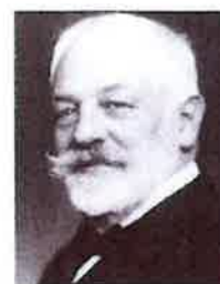
gróf Széchenyi Emil